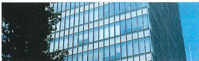
ウィリスジャパンのサービス内容