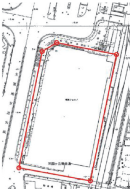
高度利用地区の区域図